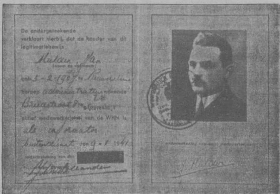
Het officiële in groene kleur uitgevoerde legitimatiebewijs, dat iedere medewerker en medewerkster van Winterhilfe Nederland in zijn bezit moet hebben en op aanvraag moet toonen

Het D.N.B. meldt voorts: Zondagmiddag trachtten vliegtuigen der Britsche luchtmacht onder de bescherming van het laaghangende wolkende de Noorsche en Nederlandsche kust te naderen. Op alle punten werden deze pogingen verijdeld. Duitse jagers schoten in de Nederlandsche kustwateren een vijandelijken bommenwerper van het type Bristol-Blenheim neer. Bij Zuid-Noorwegen werd eveneens een Bristol-Blenheim neergehaald.