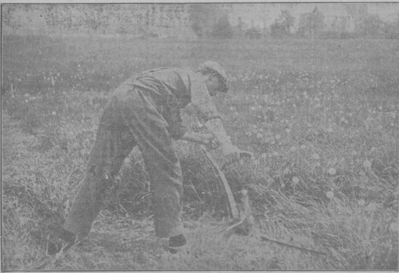
Dank zij het gunstige weer der afgelopen dagen heeft men op het platteland een begin kunnen maken met het hooien, dat thans in vollen gang is

Als de uitgebloeide sierheesters nog niet gesnoeid zijn, moet dat in elk geval deze week gebeuren. Heesters, die mooie vruchten of balletjes geven, snoeien we alleen, als ze te groot gaan worden.