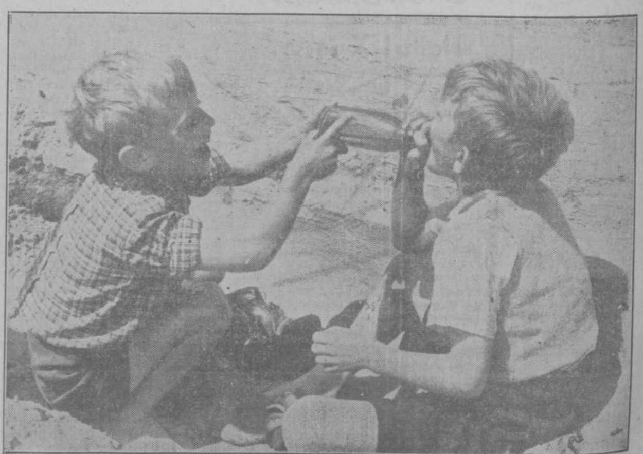
Melk is goed voor elk, maar ook een frische drank water uit een melkflesch is op een warmen dag minstens even welkom (Faz.-Holland)